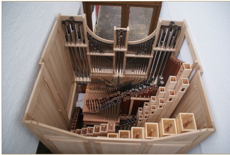
Späth / Andreas Schmutz-Organ von 2015 in der Werkstatt