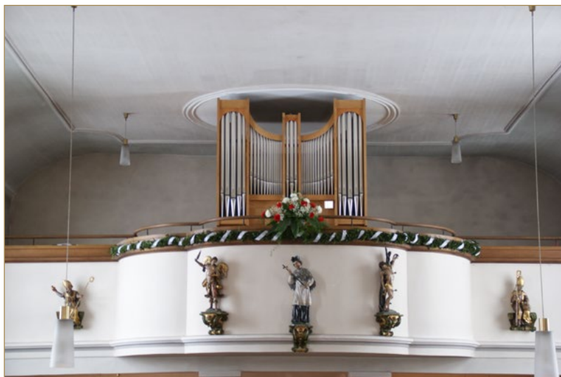
Mit einem großen Gemeindefest und Konzert wurde die Orgel am 1. Februar 2015 feierlich geweiht.

Dass die Hohenstädter in wenigen Jahren über unzählige Aktionen vollständig die finanziellen Mittel für IHRE Orgel aufreiben konnten, ist ein Zeugnis der Lebendigkeit und vorbildlich funktionierenden Gemeinschaft dieses Ortes.