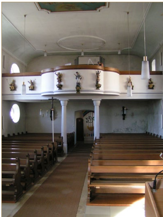
Empore, 40 Jahre ohne Pfeifenorgel...