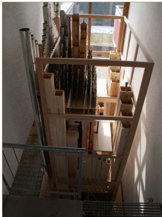
Vormontage im Betrieb