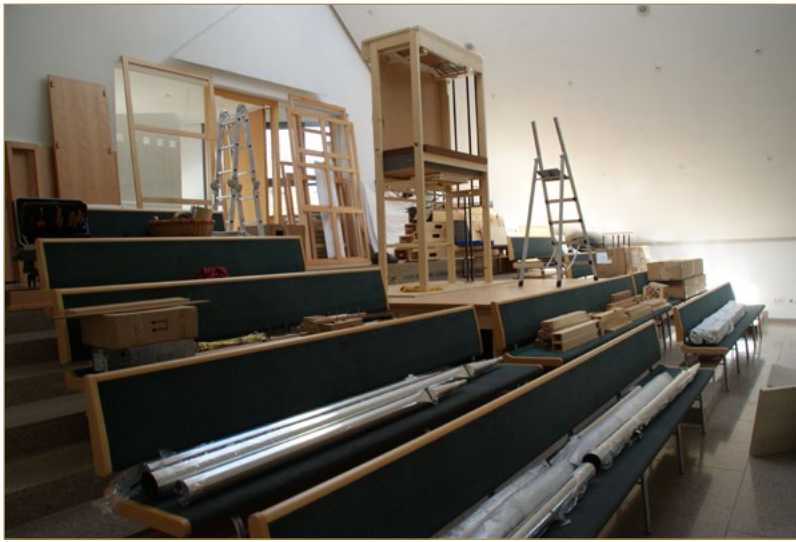
Einbau der neuen Orgel im Frühjahr 2018

In der neuapostolischen Kirche in Korb gab es bisher keine Pfeifenorgel. Umso größer war die Freude in der Gemeinde, als der Einbau der neuen Orgel im Frühjahr 2018 erfolgte. Das Instrument besticht im HW vor allem durch seine Tragfähigkeit mit dem Prinzipal 8'. Das schwellbare zweite Manual setzt mit seinen farbigen Stimmen vor allem auf Mischfähigkeit.