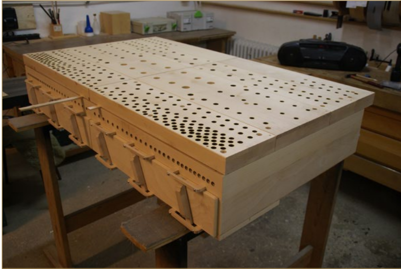
Hauptwerkswindlade mit Pfeifenstöcken